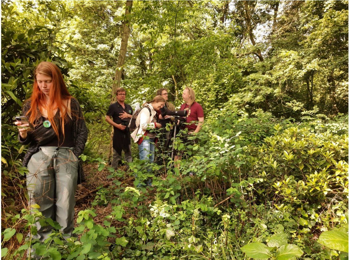
21-5-2023 Week van de biodiversiteit. Parken maand, Nationaal Park Rotterdam-1000-Soortendag, VTV Blijdorp.