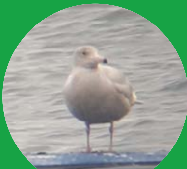
Grote Burgemeester (Pascal)