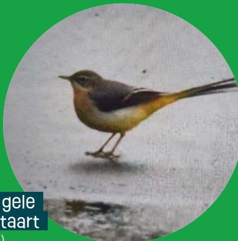
Grote gele kwikstaart (Sharida)