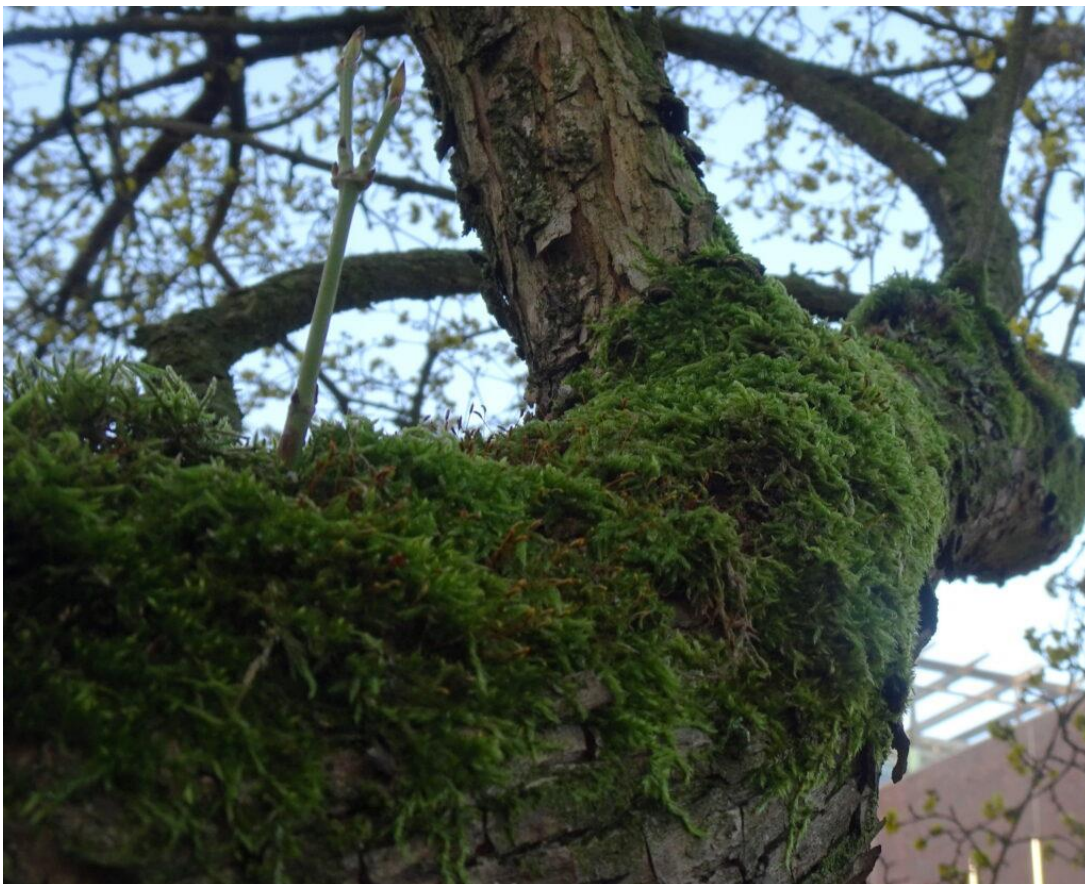
80-jaar oude kornoelje in de tuin van het Chabot museum.