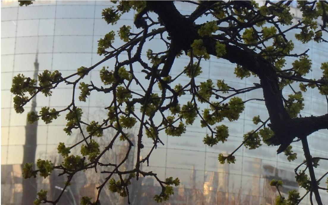
80-jaar oude kornoelje in de tuin van het Chabot museum.