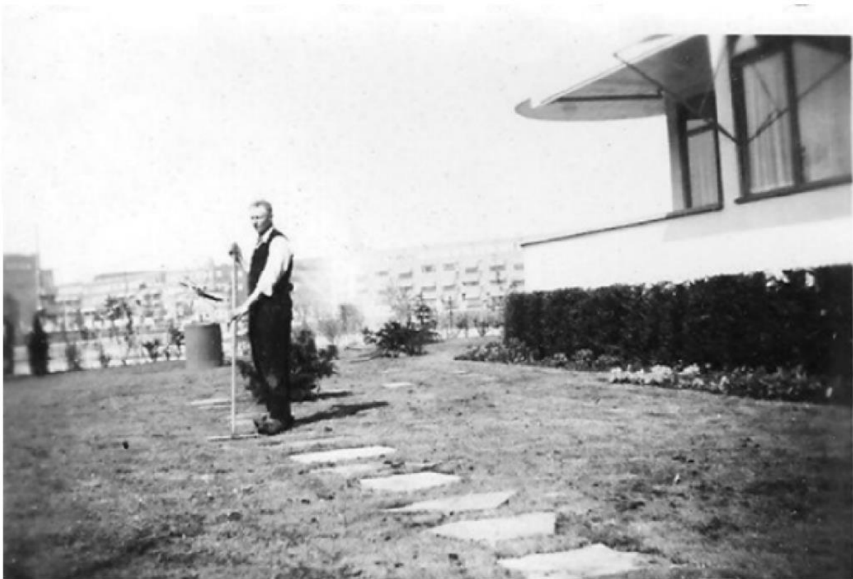
Foto van de tuin van de villa (nu Chabotmuseum) kort voor WO II. Kale, lege tuinen waren toen trendy.

In de grote, kale, lege tuinen in de omgeving van het Boymans museum werden verschillende bijzondere bomen en struiken geplant. Allereerst voor de eigenaren zelf, zodat zij een gezelliger zondagmiddagwandelingetje in de eigen omgeving konden maken.