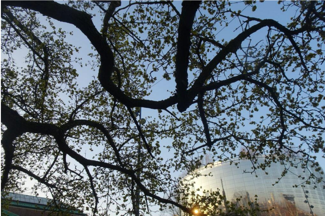
80-jaar oude kornoelje in de tuin van het Chabot museum.