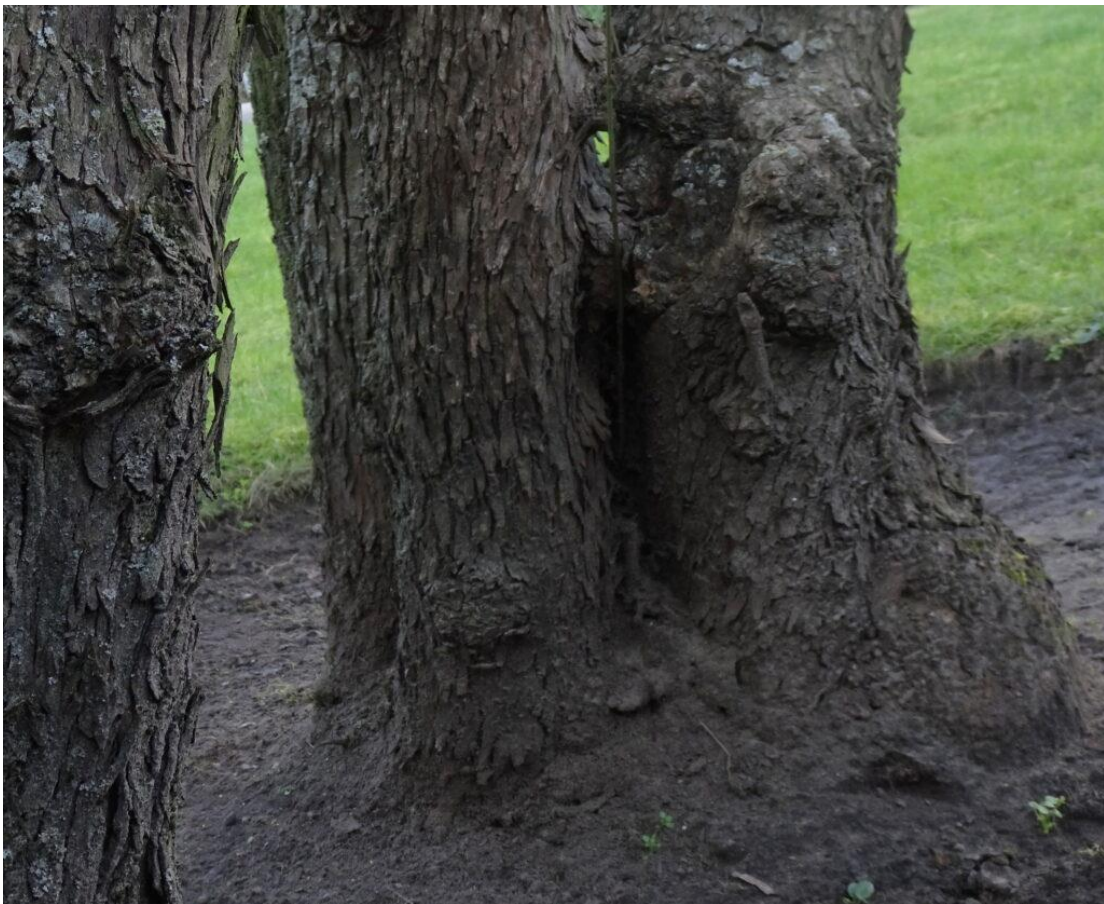
80-jaar oude kornoelje in de tuin van het Chabot museum.