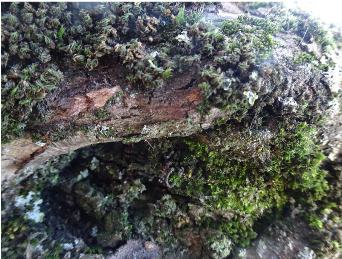
80-jaar oude kornoelje in de tuin van het Chabot museum.