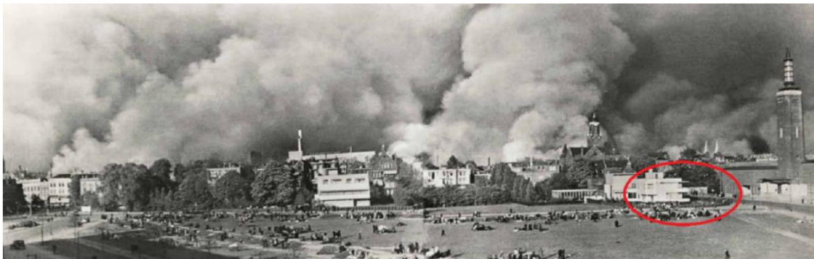
Foto: Het villapark ( nu Chabot museum) in aanbouw. Op de achtergrond de brandende stad, mei 1940.

De staat kon niets doen voor de benodigde veiligheid en ondersteuning. De schade was te groot.