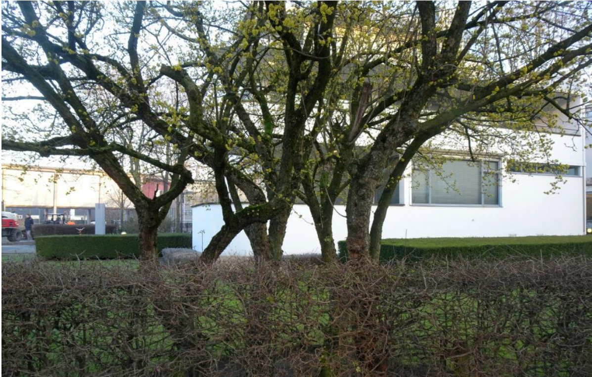
De tweede 80-jaar oude kornoelje in de tuin van het Chabot museum.

De gele kornoelje is het mooist wanneer hij ruimte om zich heen heeft. Oude exemplaren van deze omvang zie je eigenlijk alleen maar in tuinen van oude boerderijen, herenhuizen, buitenverblijven, kasteelparken, kloosters, parochiën en....in de tuin van het Chabot museum!