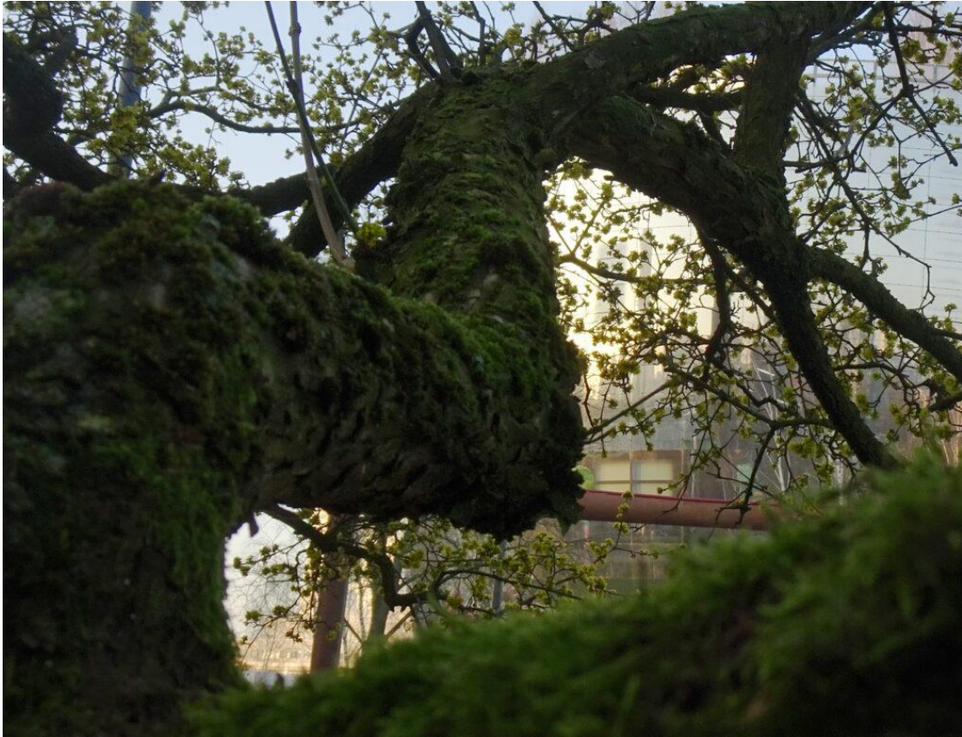
80-jaar oude kornoelje in de tuin van het Chabot museum.