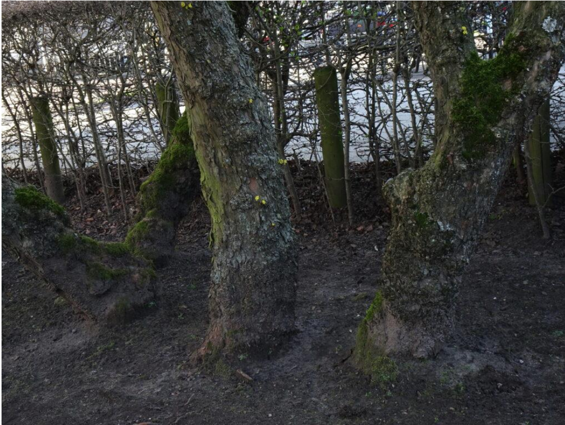
80-jaar oude kornoelje in de tuin van het Chabot museum.