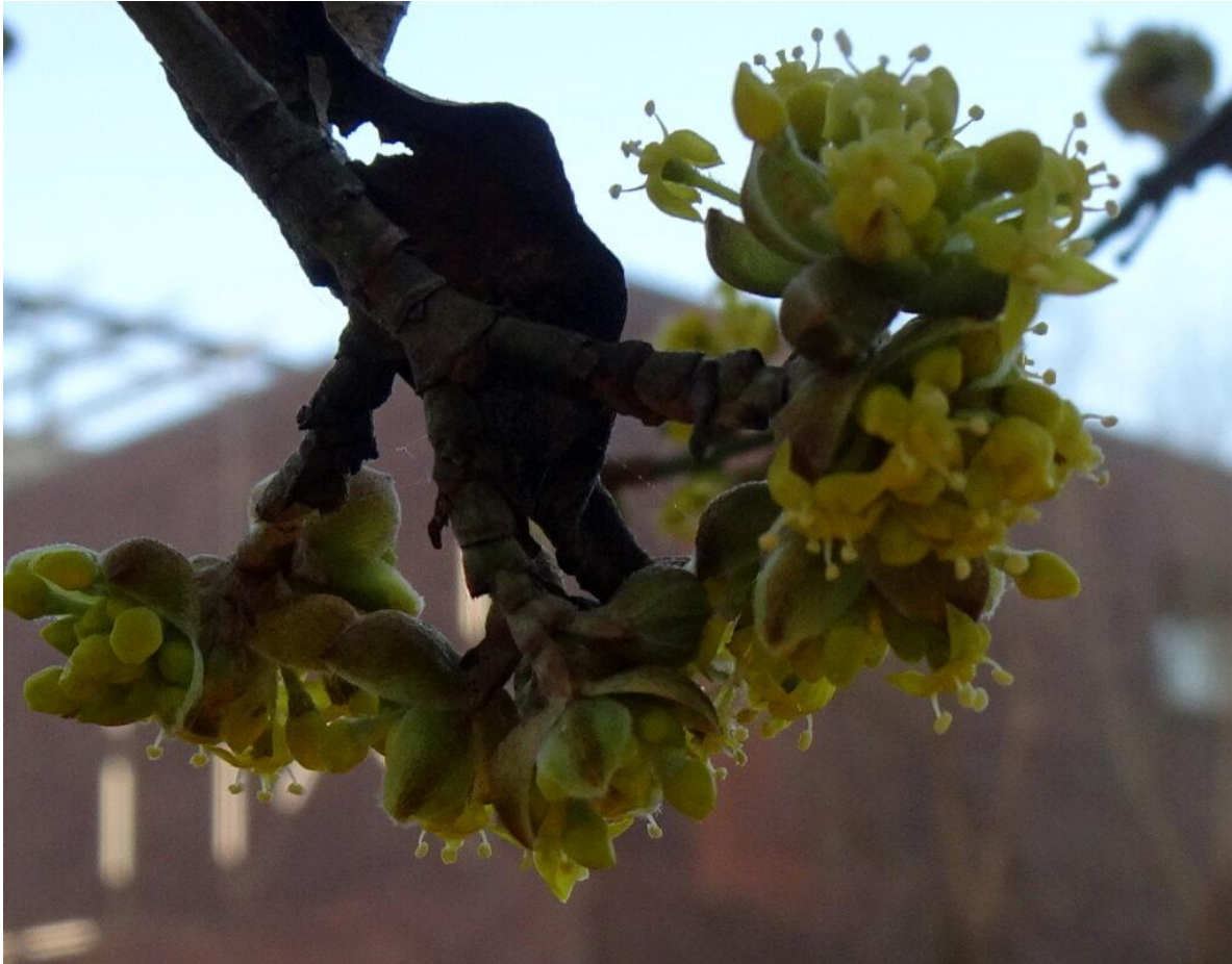
80-jaar oude kornoelje in de tuin van het Chabot museum.