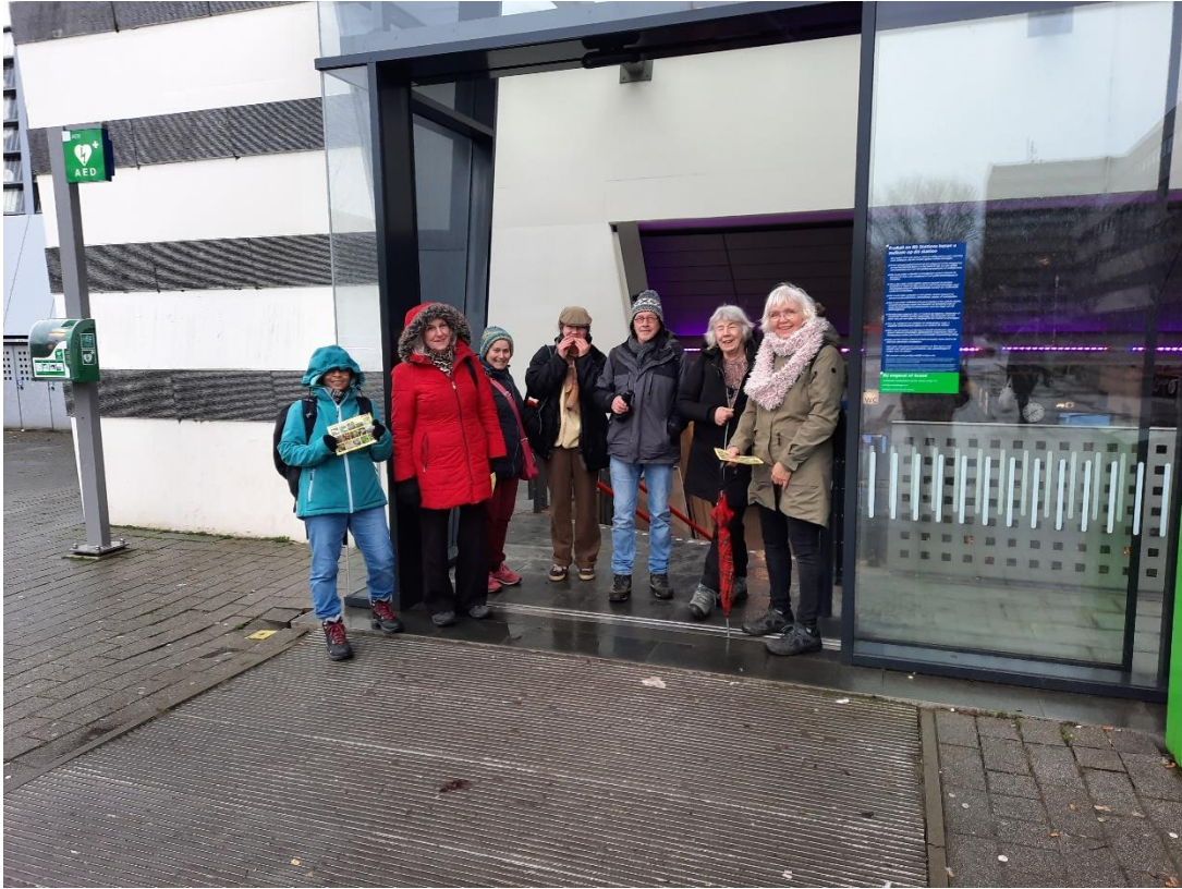
Met de fotograaf mee zijn we met zijn achten