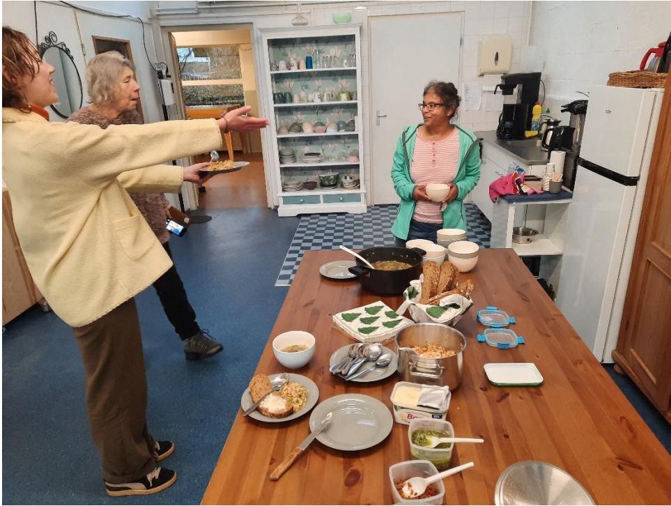
Shariada heeft deze excursie georganiseerd