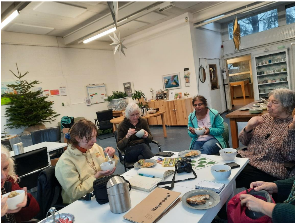
De soep en de hapjes smaken heerlijk