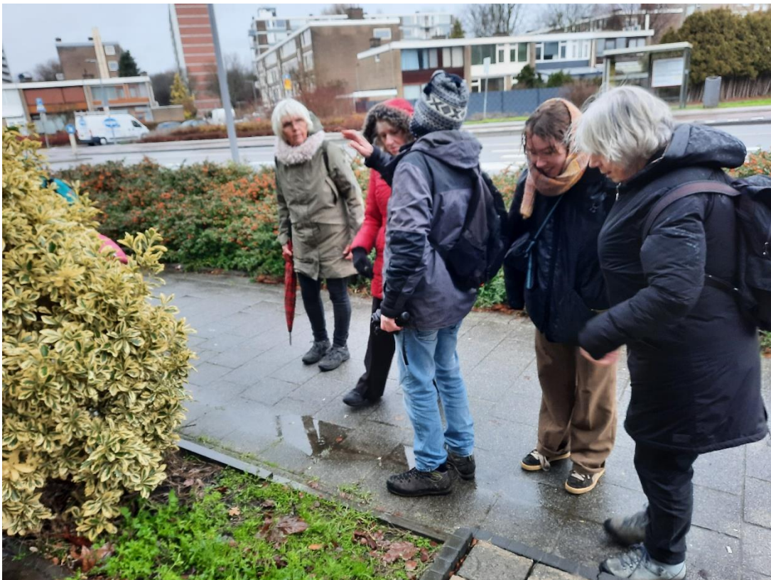
Samen vind je meer